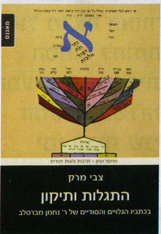
ספריו הקודמים של פרופ' מרק

אותו אליו. ידוע לנו שבהיותו נער ניסה להסתיר מהמבוגרים את אדיקותו ופעם אחת אף העמיד פנים כאילו שכח את האלף-בית, אולם האמת היא שהיה שקוע בעולם נסתר של תפילה ולימוד.