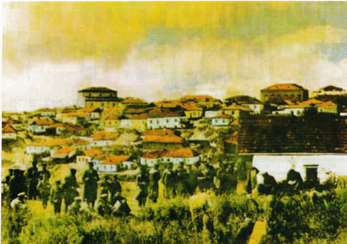
ציור ישן של עליית חסידי ברסלב לקברו של ר' נחמן באומן